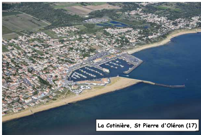
La Cotinière, St Pierre d'Oléron (17)