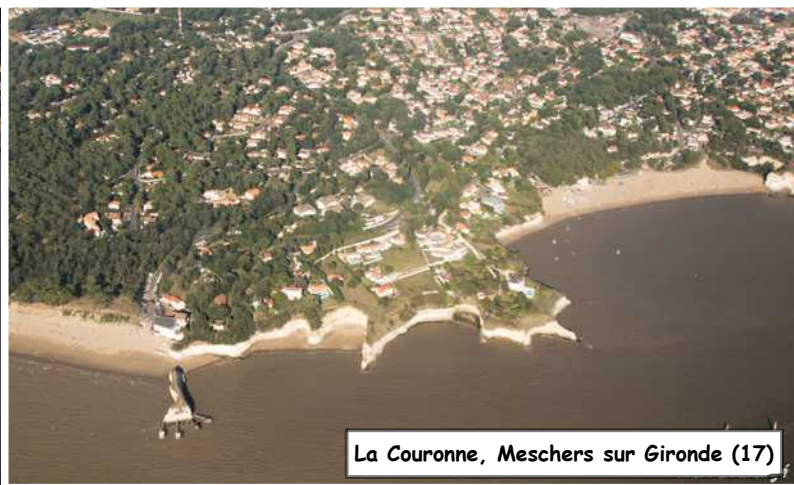
La Couronne, Meschers sur Gironde (17)