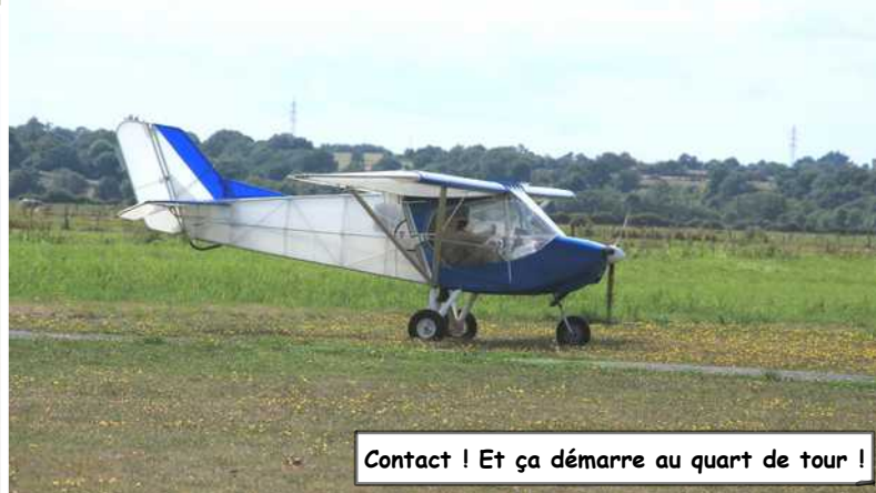
Contact ! Et ça démarre au quart de tour !