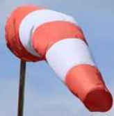
Quelque part, en Loire-Atlantique

Frossay ULM Le 11 Août 2017 Les deux ULM du club..... et un visiteur