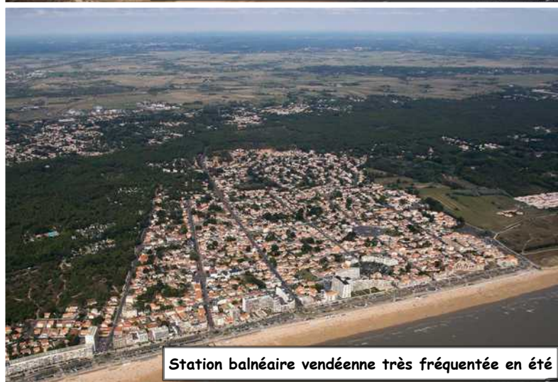
Station balnéaire vendéenne très fréquentée en été