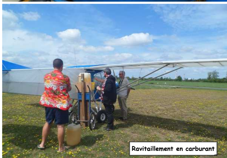
Ravitaillement en carburant