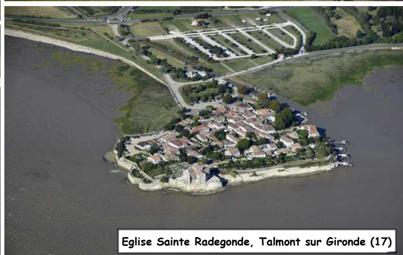
Eglise Sainte Radegonde, Talmont sur Gironde (17)