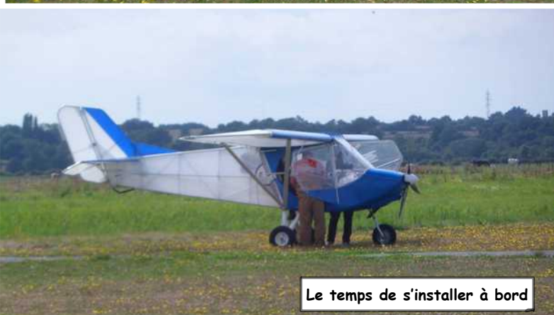
Le temps de s'installer à bord