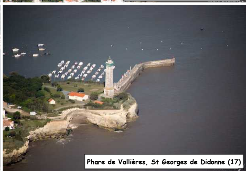
Phare de Vallières, St Georges de Didonne (17)