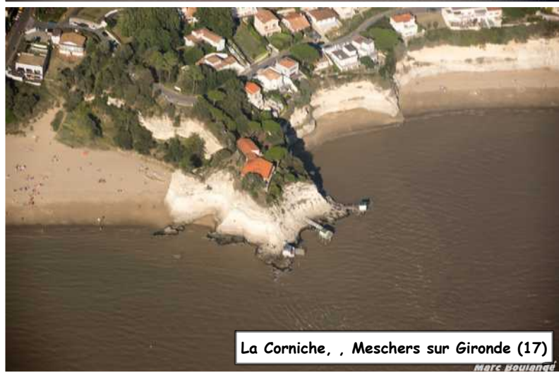
La Corniche, , Meschers sur Gironde (17)