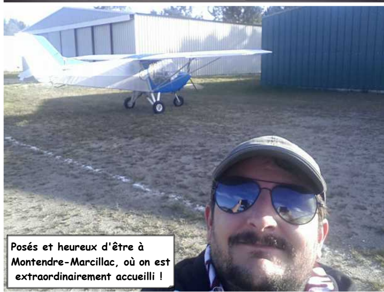
Posés et heureux d'être à Montendre-Marcillac, où on est extraordinairement accueilli !