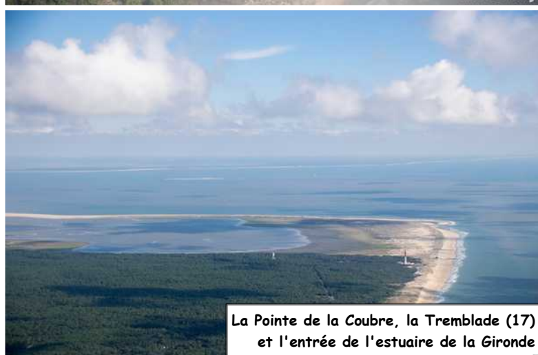
La Pointe de la Coubre, la Tremblade (17) et l'entrée de l'estuaire de la Gironde