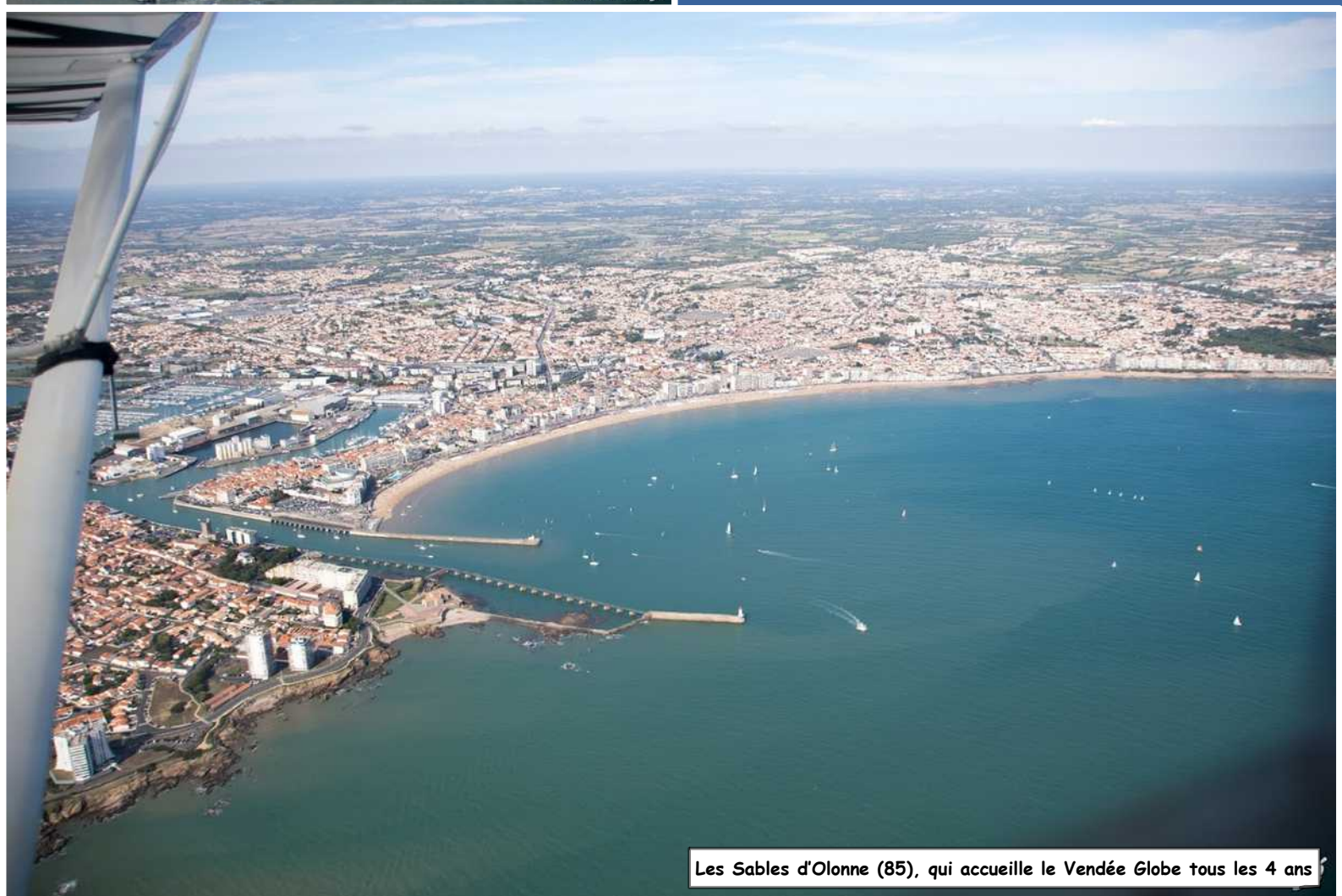
Les Sables d'Olonne (85), qui accueille le Vendée Globe tous les 4 ans