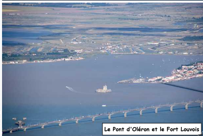
Le Pont d'Oléron et le Fort Louvois