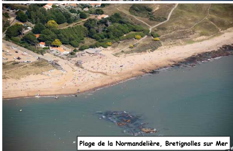
Plage de la Normandelière, Bretignolles sur Mer