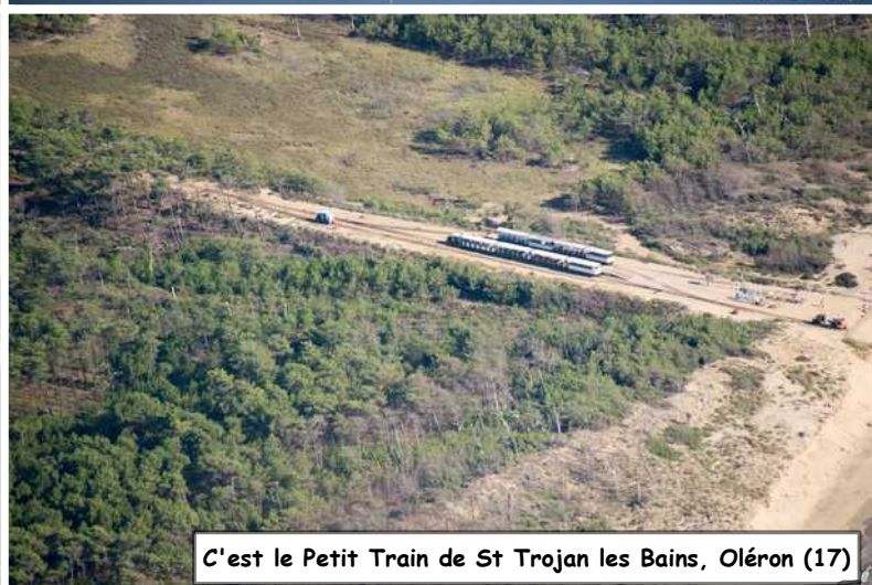
C'est le Petit Train de St Trojan les Bains, Oléron (17)