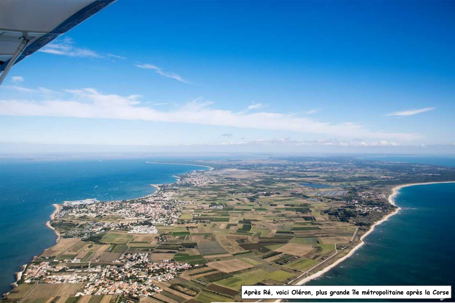
Après Ré, voici Oléron, plus grande île métropolitaine après la Corse