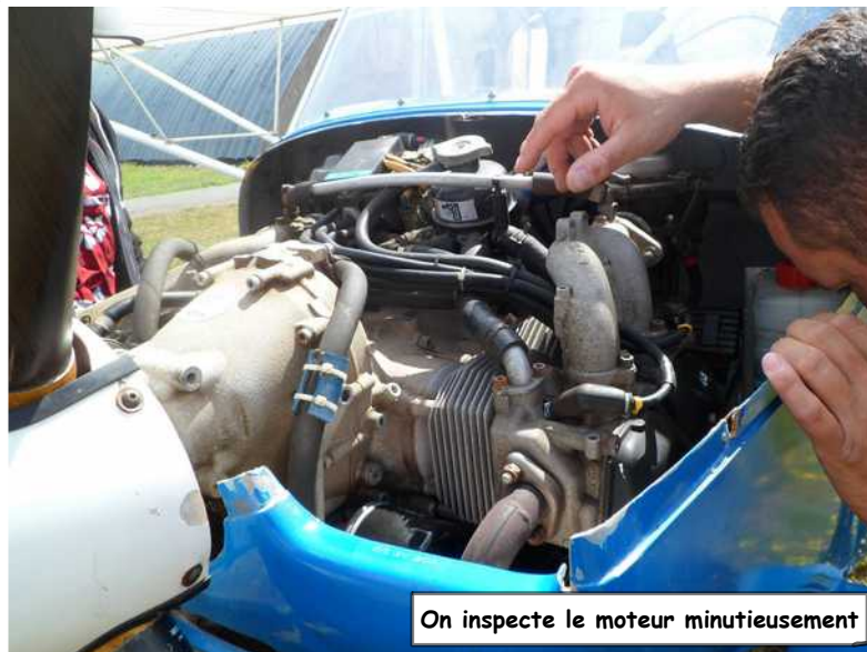
On inspecte le moteur minutieusement