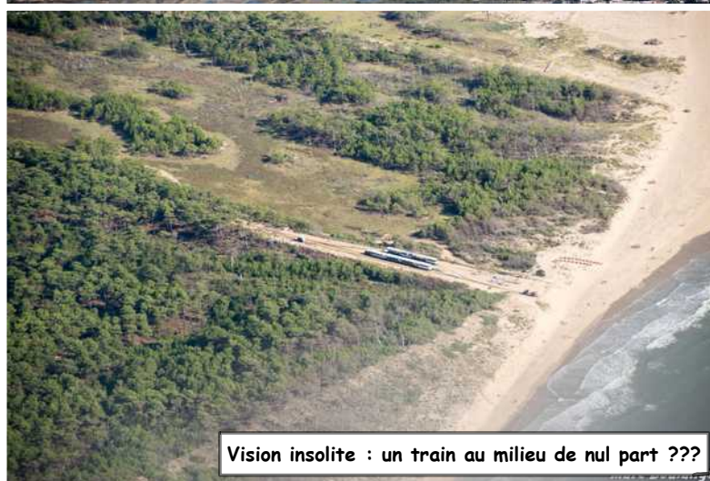
Vision insolite : un train au milieu de nul part ???