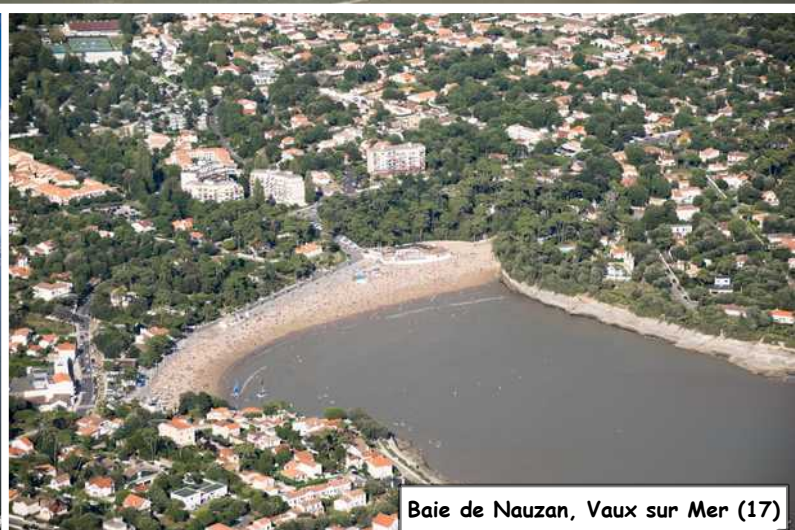
Baie de Nauzan, Vaux sur Mer (17)