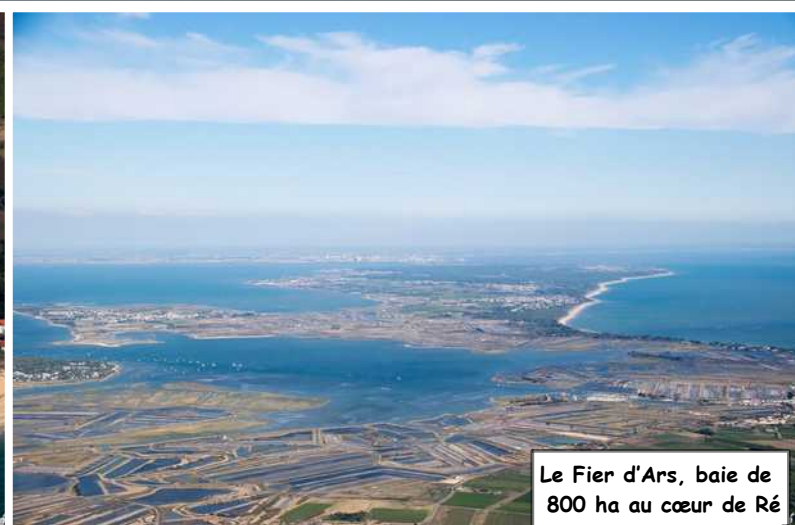
Le Fier d'Ars, baie de 800 ha au cœur de Ré