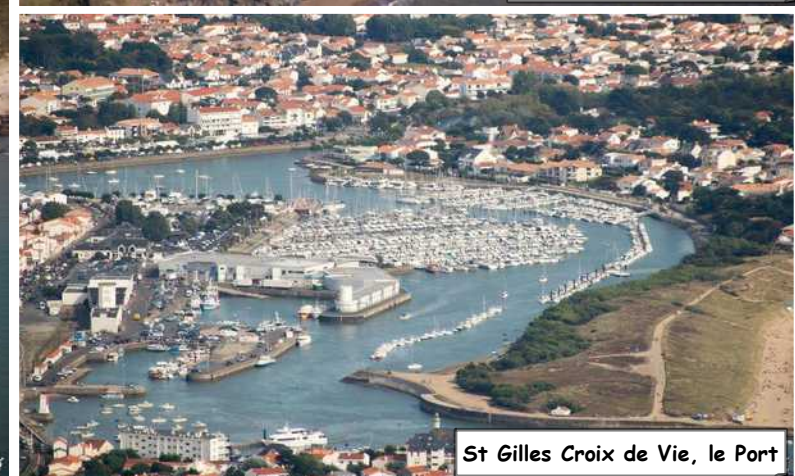
St Gilles Croix de Vie, le Port