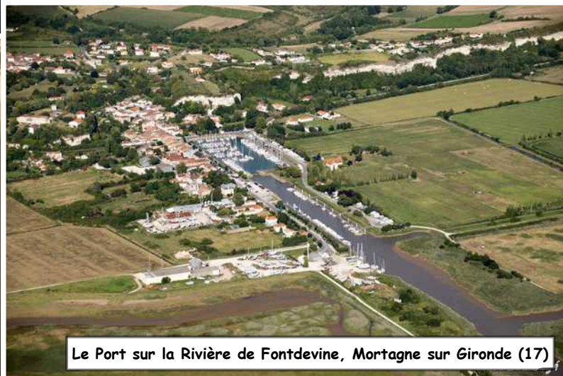
Le Port sur la Rivière de Fontdevine, Mortagne sur Gironde (17)