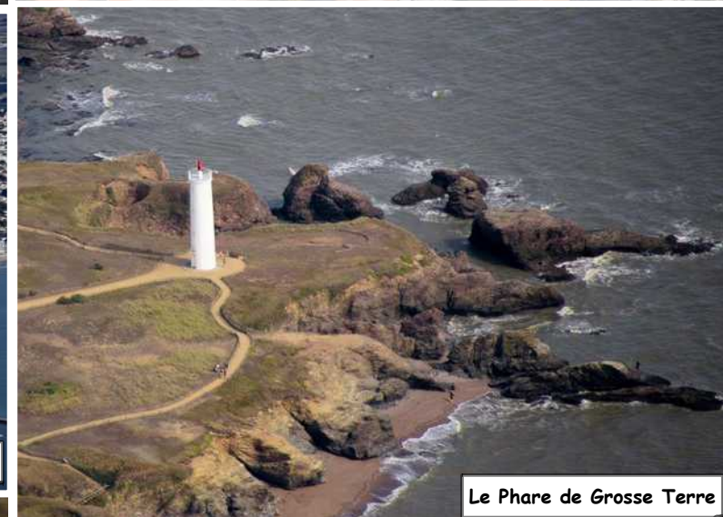
Le Phare de Grosse Terre