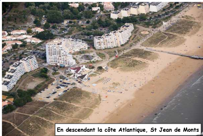
En descendant la côte Atlantique, St Jean de Monts