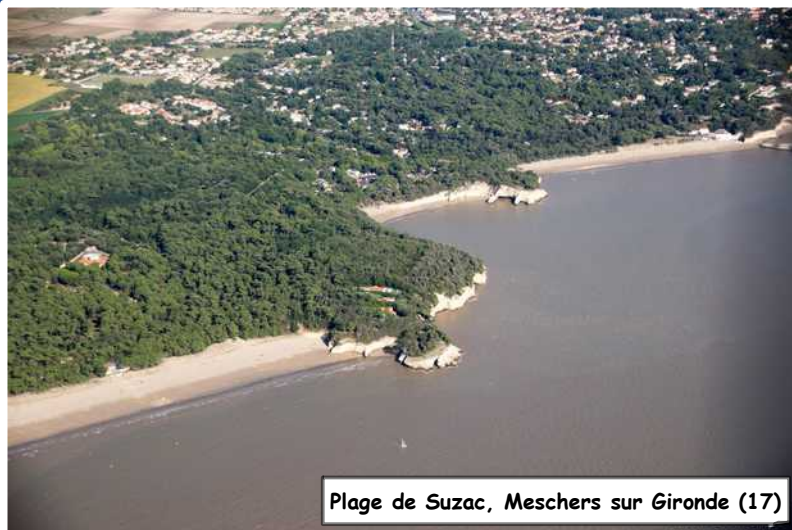
Plage de Suzac, Meschers sur Gironde (17)