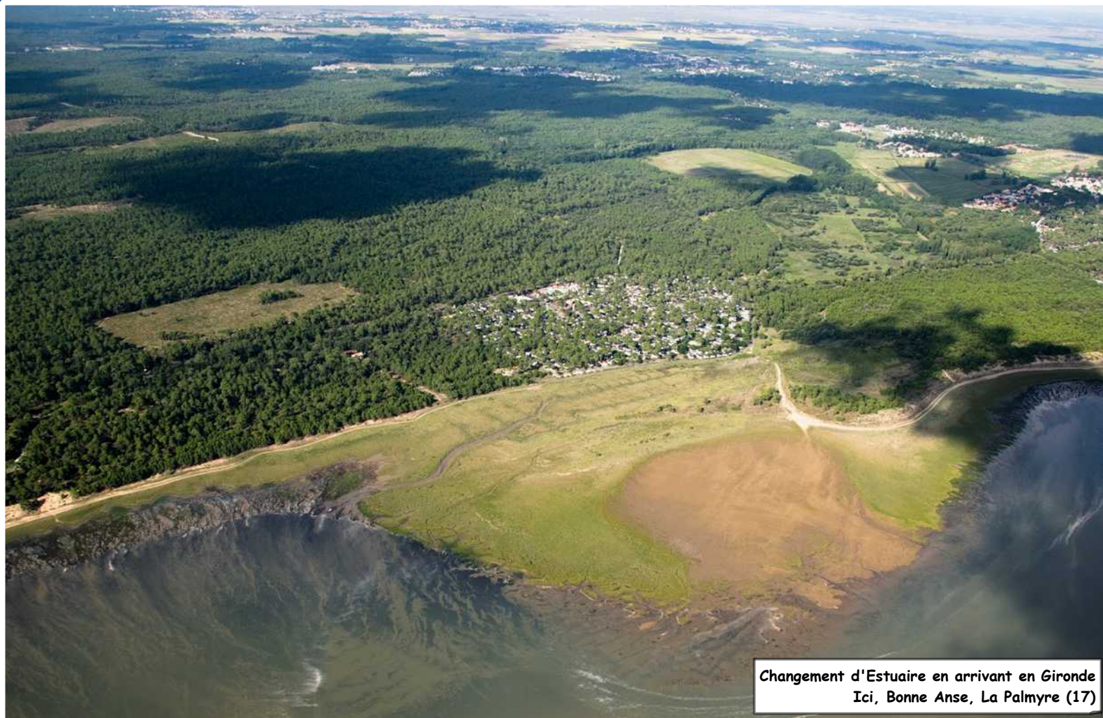
Changement d'Estuaire en arrivant en Gironde Ici, Bonne Anse, La Palmyre (17)