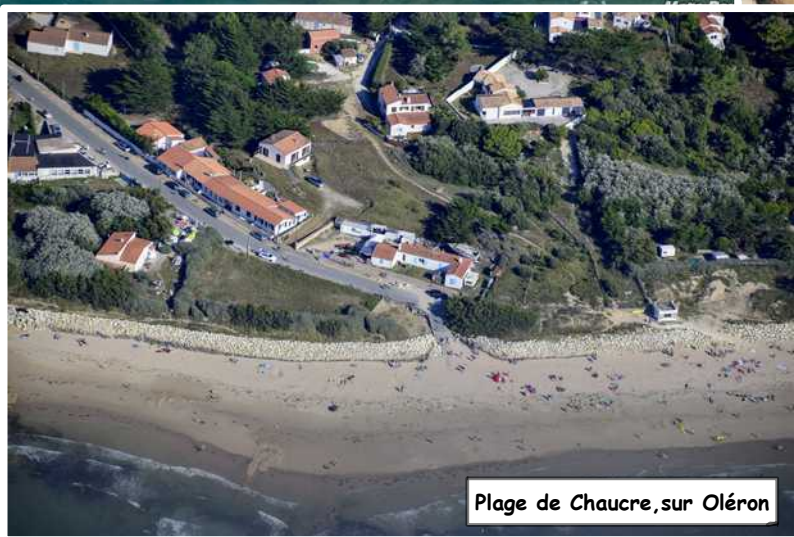
Plage de Chaucre, sur Oléron