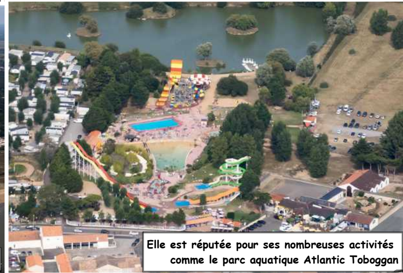
Elle est réputée pour ses nombreuses activités comme le parc aquatique Atlantic Toboggan