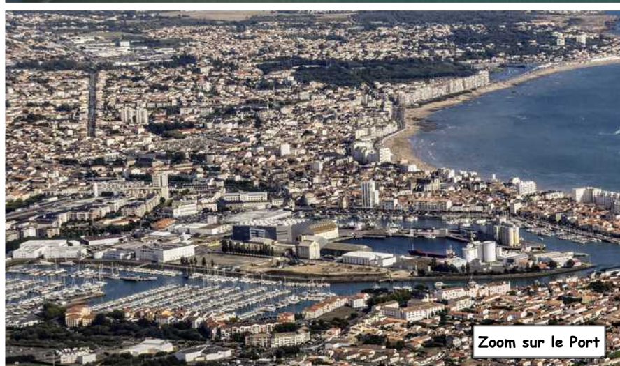
Zoom sur le Port