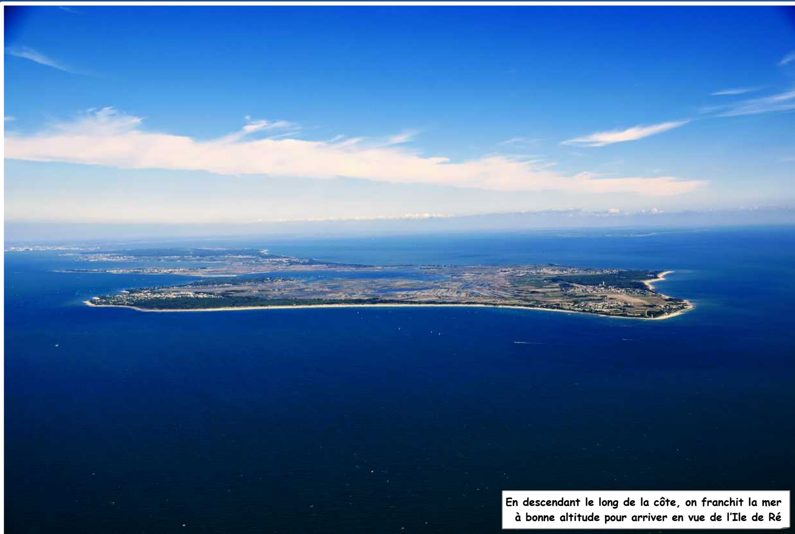
En descendant le long de la côte, on franchit la mer à bonne altitude pour arriver en vue de l'Ile de Ré