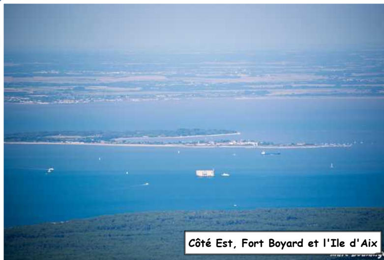
Côté Est, Fort Boyard et l'Ile d'Aix