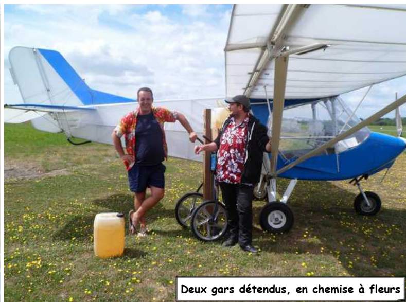
Deux gars détendus, en chemise à fleurs