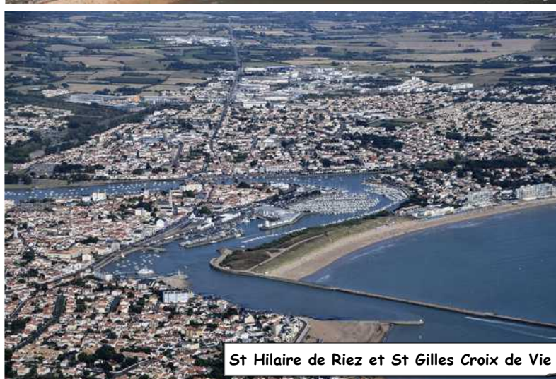
St Hilaire de Riez et St Gilles Croix de Vie