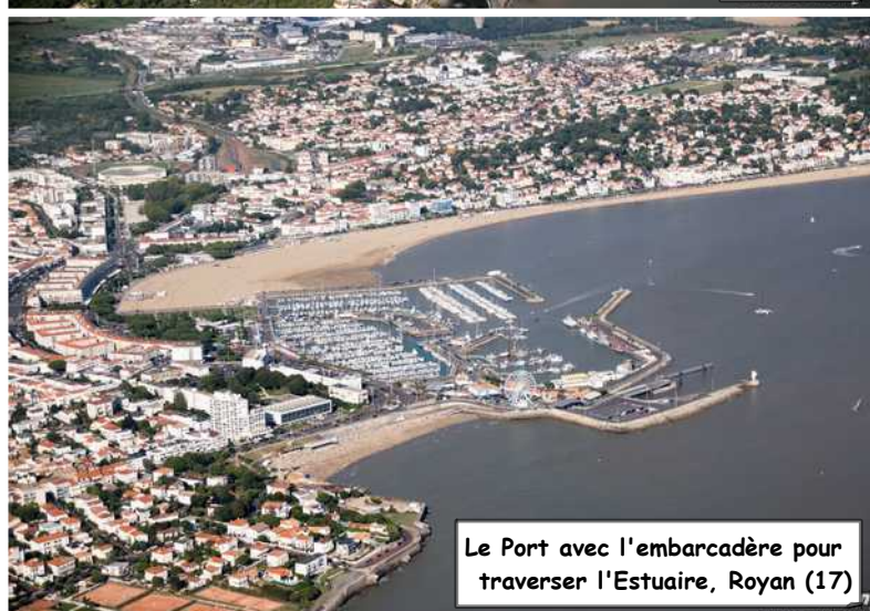
Le Port avec l'embarcadere pour traverser l'Estuaire, Royan (17)