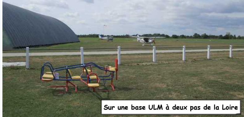
Sur une base ULM à deux pas de la Loire

Frossay ULM Le 11 Août 2017 Les deux ULM du club..... et un visiteur