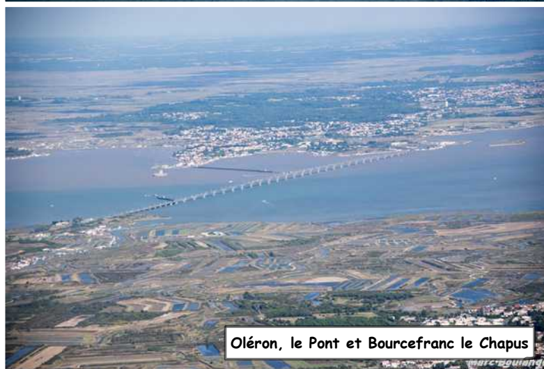
Oléron, le Pont et Bourcefranc le Chapus