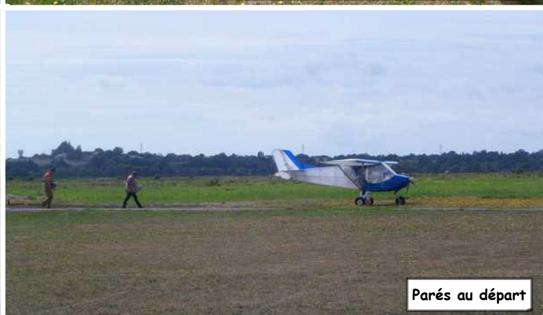
Parés au départ