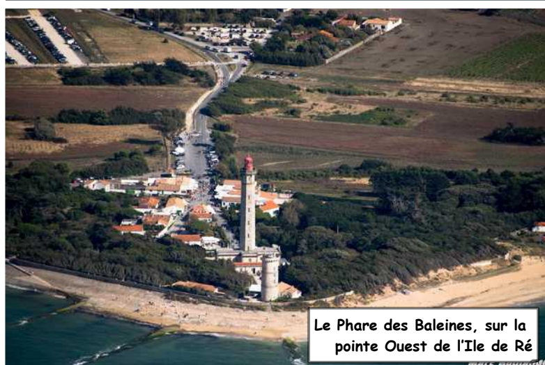
Le Phare des Baleines, sur la pointe Ouest de l'Ile de Ré