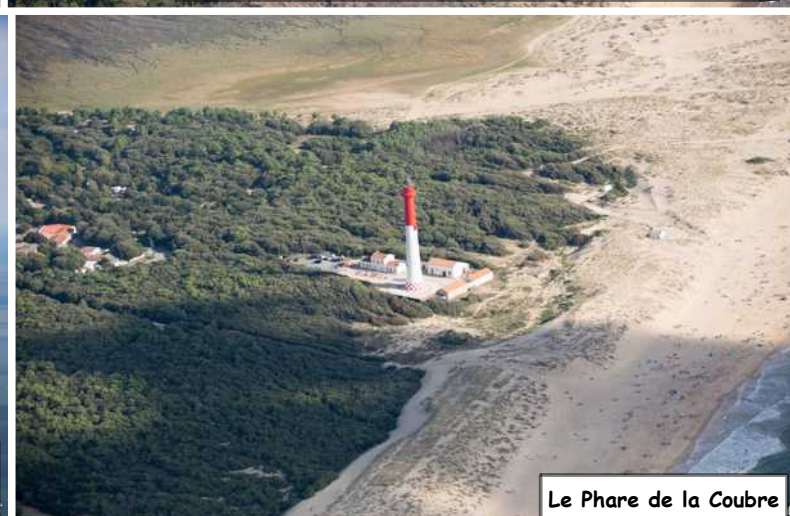
Le Phare de la Coubre