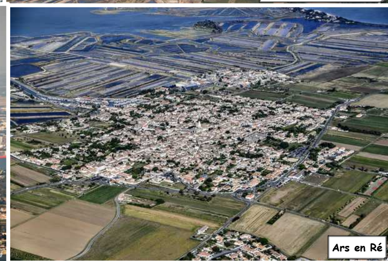
Ars en Ré