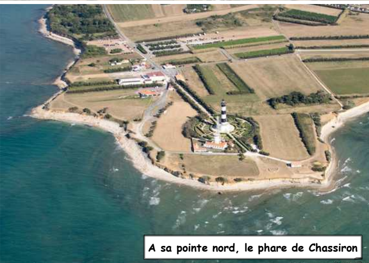
A sa pointe nord, le phare de Chassiron