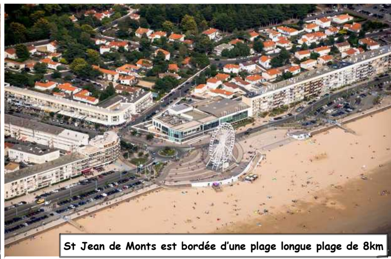
St Jean de Monts est bordée d'une longue plage de 8km