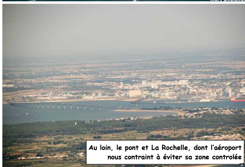
Au loin, le pont et La Rochelle, dont l'aéroport nous contraint à éviter sa zone contrôlée