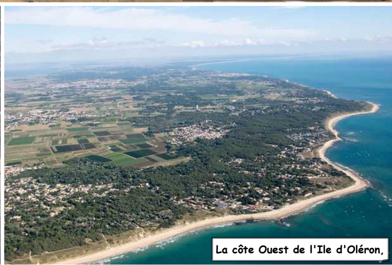
La côte Ouest de l'Ile d'Oléron,