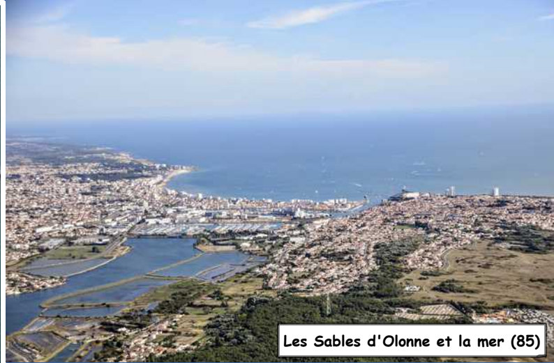
Les Sables d'Olonne et la mer (85)