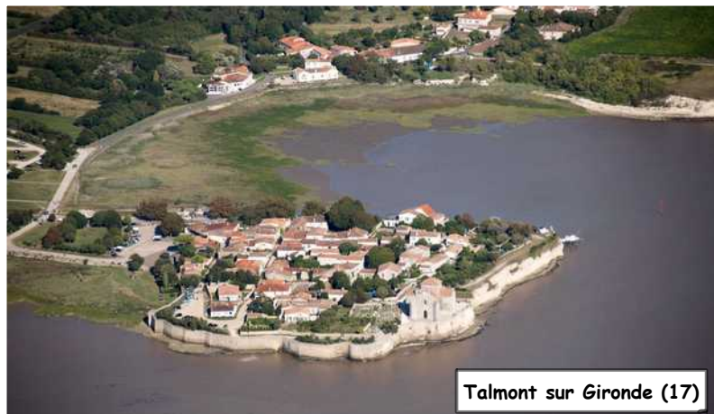
Talmont sur Gironde (17)