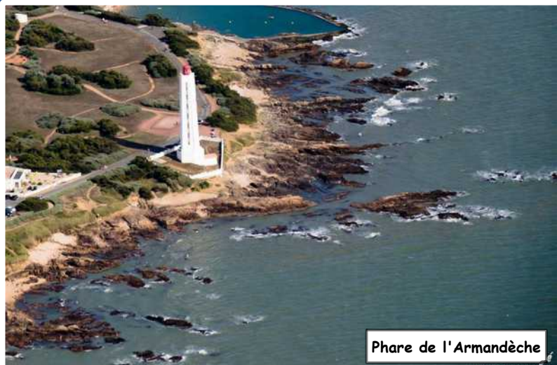
Phare de l'Armandèche