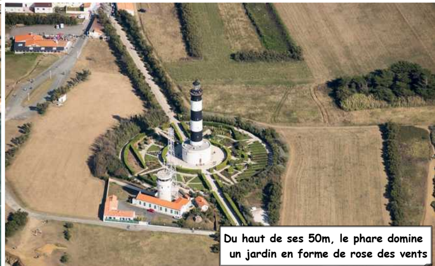
Du haut de ses 50m, le phare domine un jardin en forme de rose des vents