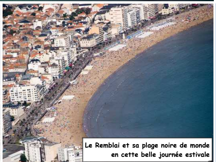
Le Remblai et sa plage noire de monde en cette belle journée estivale