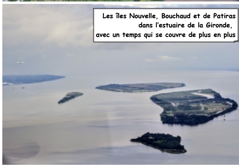
Les îles Nouvelle, Bouchaud et de Patiras dans l'estuaire de la Gironde, avec un temps qui se couvre de plus en plus