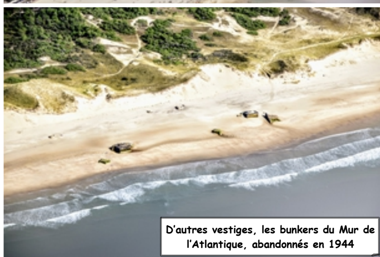
D'autres vestiges, les bunkers du Mur de l'Atlantique, abandonnés en 1944