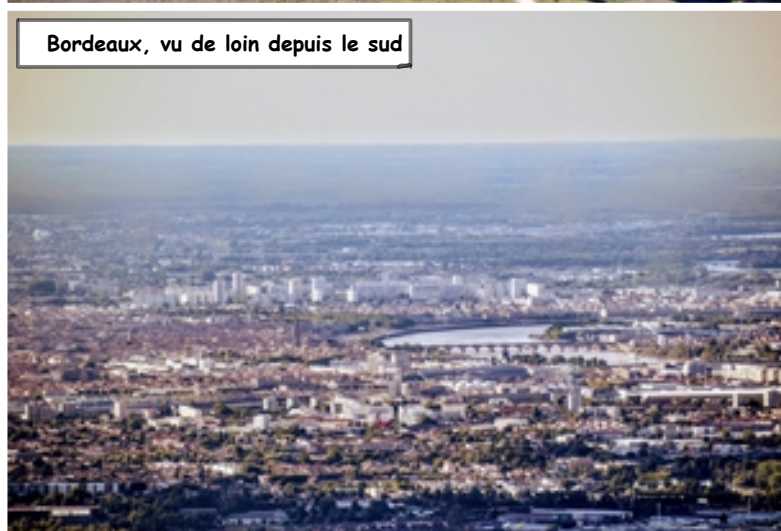
Bordeaux, vu de loin depuis le sud