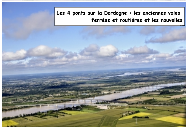
Les 4 ponts sur la Dordogne : les anciennes voies ferrées et routières et les nouvelles