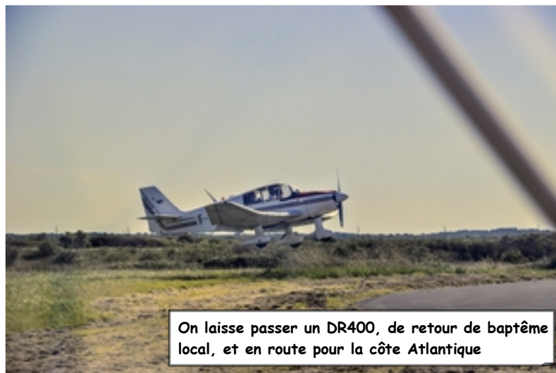
On laisse passer un DR400, de retour de baptême local, et en route pour la côte Atlantique