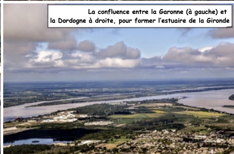
La confluence entre la Garonne (à gauche) et la Dordogne à droite, pour former l'estuaire de la Gironde