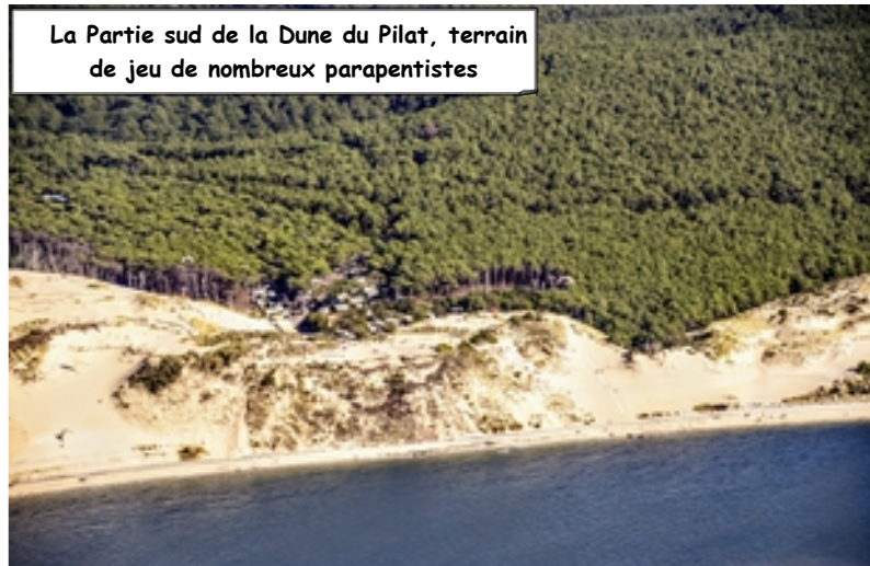
La Partie sud de la Dune du Pilat, terrain de jeu de nombreux parapentistes