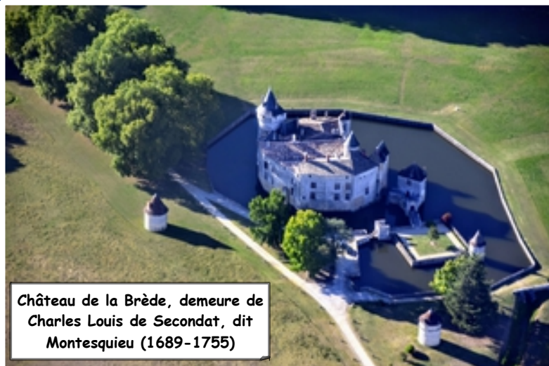
Château de la Brède, demeure de Charles Louis de Secondat, dit Montesquieu (1689-1755)