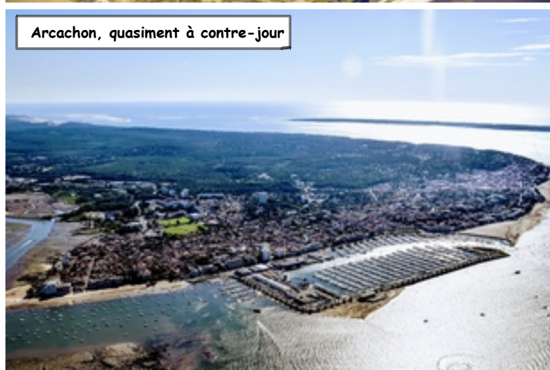
Arcachon, quasiment à contre-jour