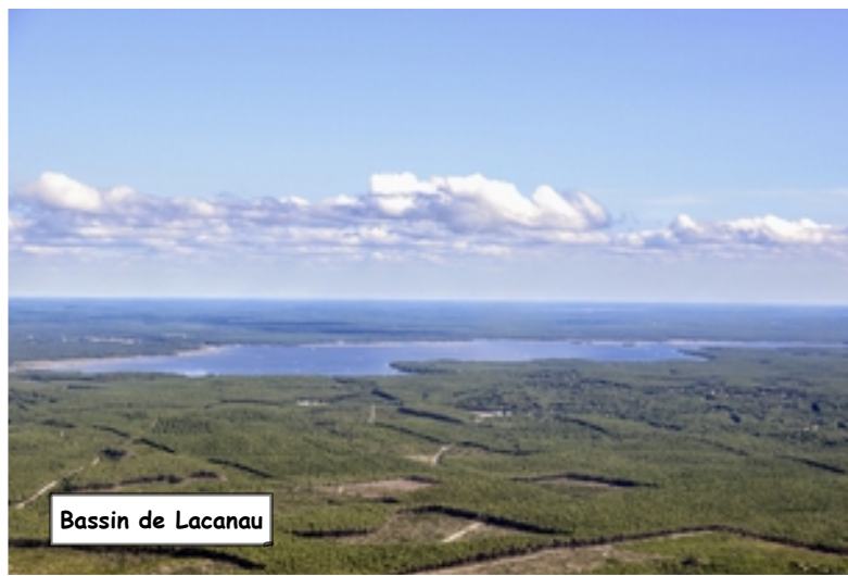
Bassin de Lacanau