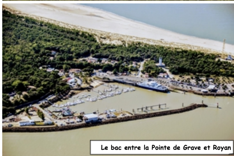
Le bac entre la Pointe de Grave et Royan