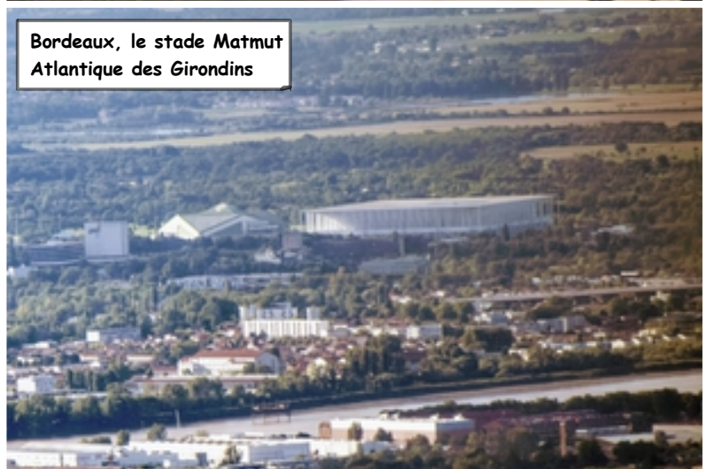
Bordeaux, le stade Matmut Atlantique des Girondins