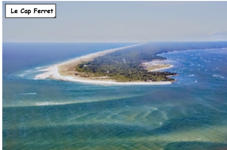
Le Cap Ferret