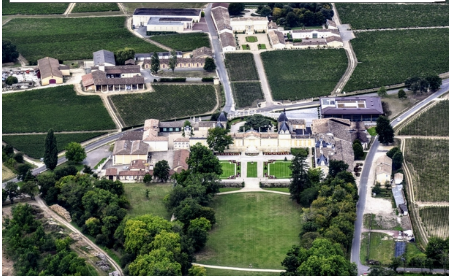
Château Ducru Beaucaillou à Saint-Julien-Beycheville (33)

En longeant le Médoc, sur notre gauche, on découvre une multitude de domaines et de châteaux, entourés par un vignoble à la renommée mondiale. Ici, le Château de Beycheville