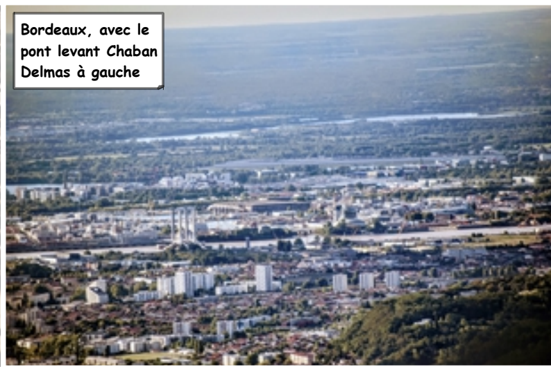
Bordeaux, avec le pont levant Chaban Delmas à gauche