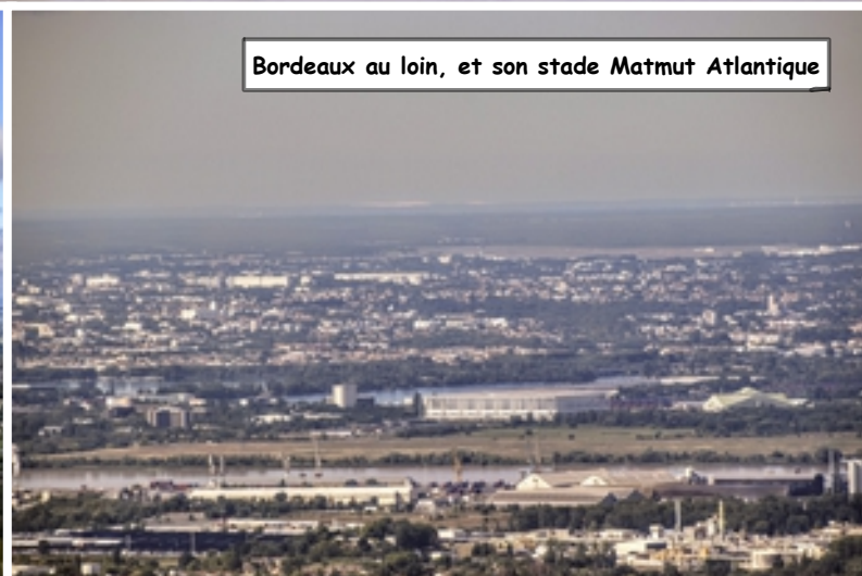
Bordeaux au loin, et son stade Matmut Atlantique