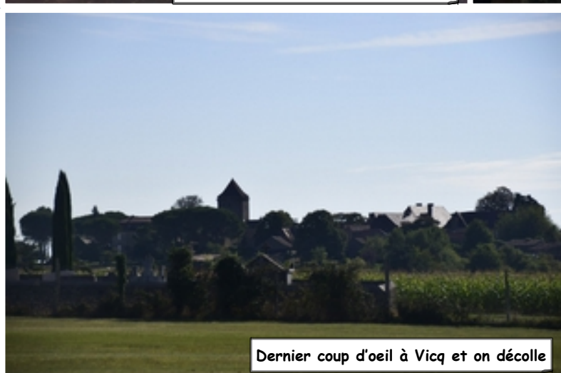
Dernier coup d'oeil à Vicq et on décolle