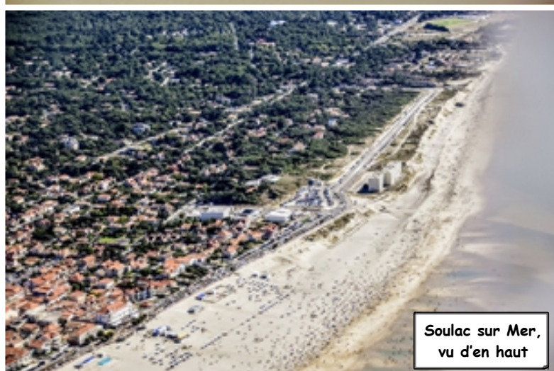
Soulac sur Mer, vu d'en haut