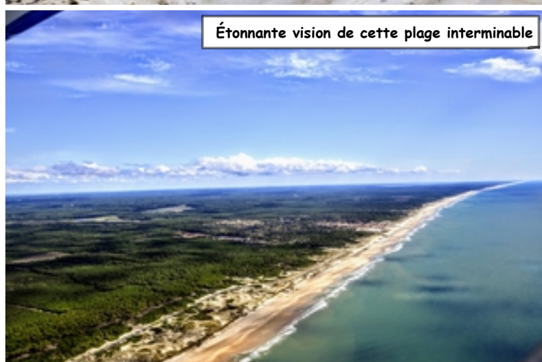
Étonnante vision de cette plage interminable