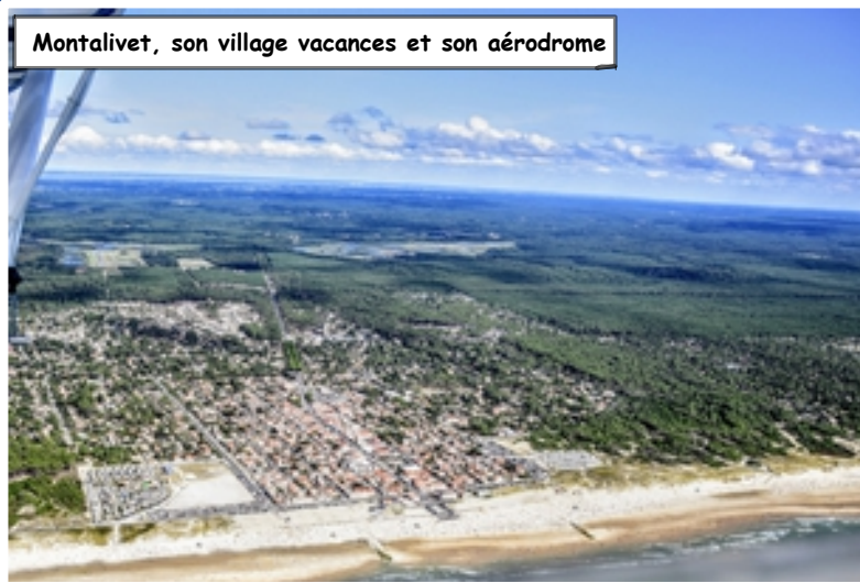
Montalivet, son village vacances et son aérodrome