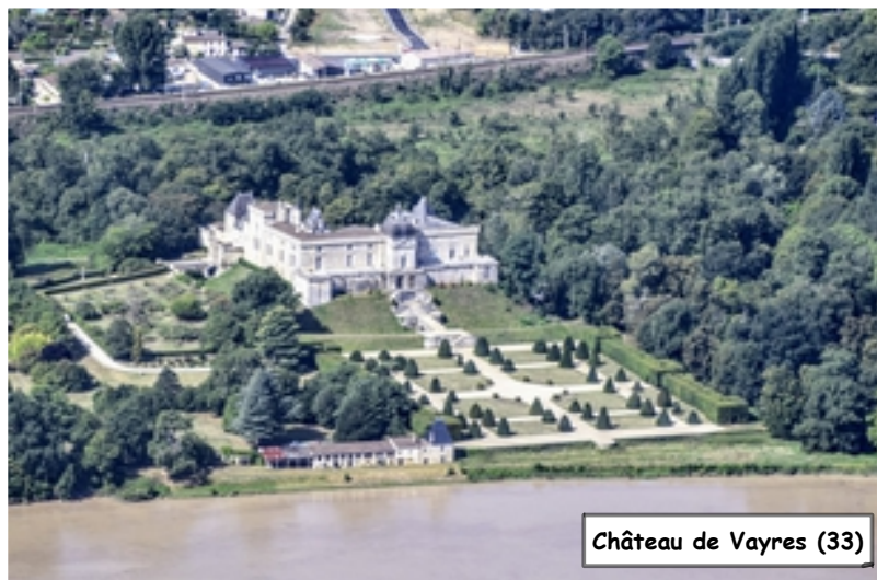
Château de Vayres (33)