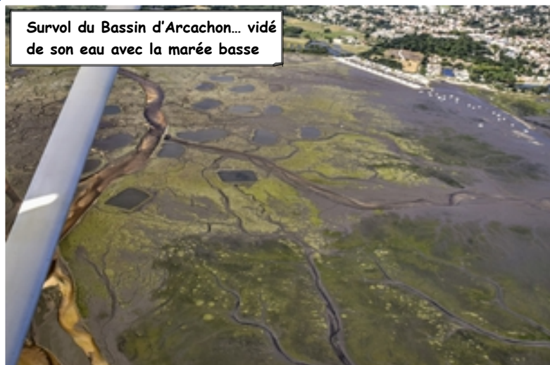
Survol du Bassin d'Arcachon... vidé de son eau avec la marée basse