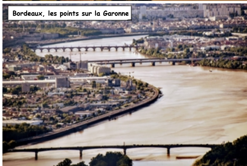
Bordeaux, les points sur la Garonne