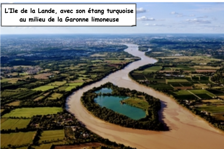
L'Ile de la Lande, avec son étang turquoise au milieu de la Garonne limoneuse