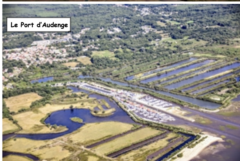
Le Port d'Audenge