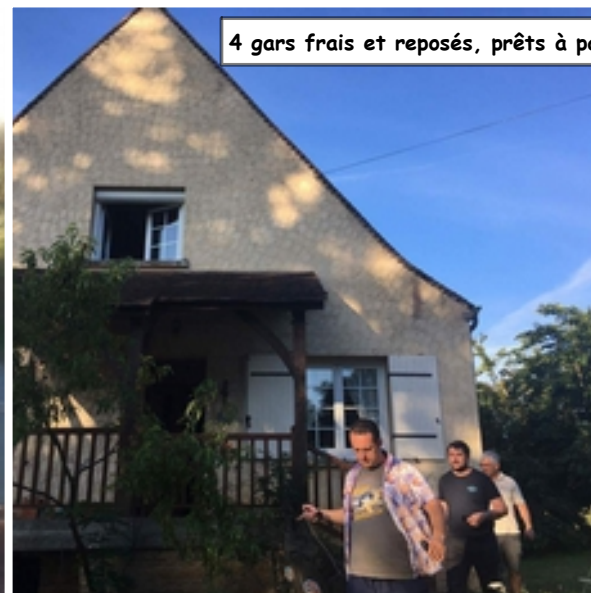
4 gars frais et reposés, prêts à passer une excellente journée