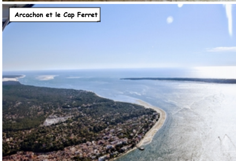
Arcachon et le Cap Ferret