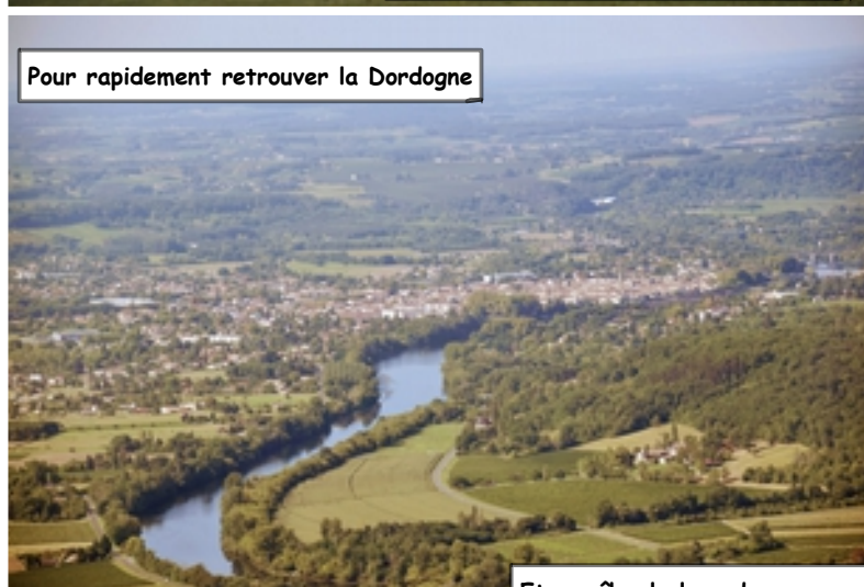
Pour rapidement retrouver la Dordogne