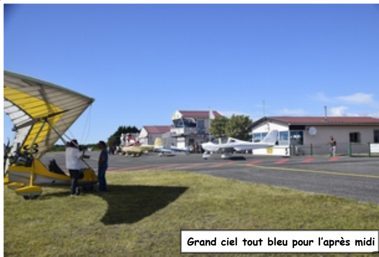
Grand ciel tout bleu pour l'après midi