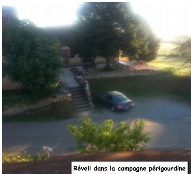
Réveil dans la campagne périgourdine