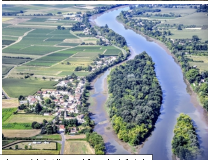
Et ses îles le long de son cours sinueux, qui devient limoneux à l'approche de l'estuaire