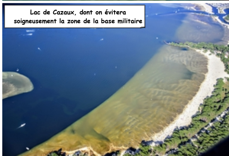
Lac de Cazaux, dont on évitera soigneusement la zone de la base militaire