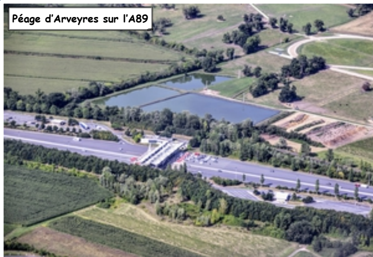
Péage d'Arveyres sur l'A89