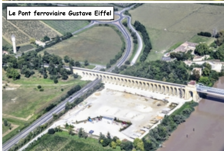
Le Pont ferroviaire Gustave Eiffel