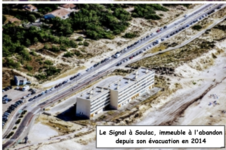
Le Signal à Soulac, immeuble à l'abandon depuis son évacuation en 2014