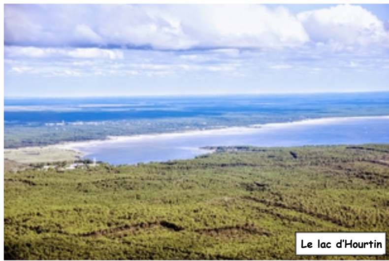
Le lac d'Hourtin