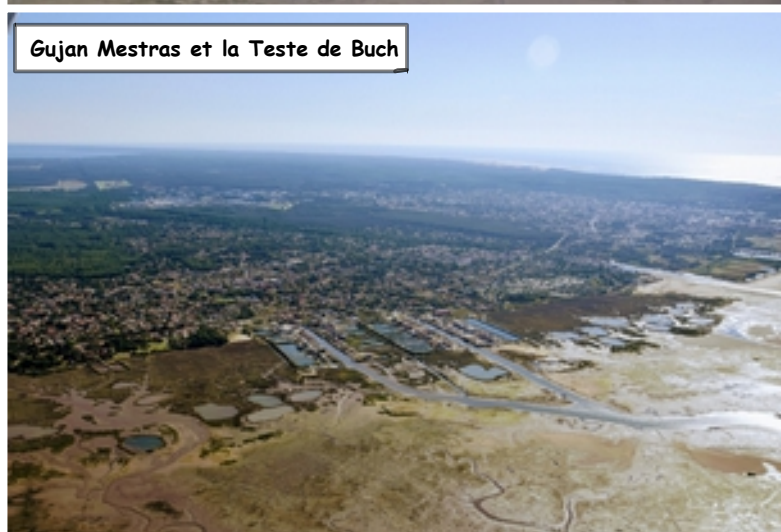
Gujan Mestras et la Teste de Buch