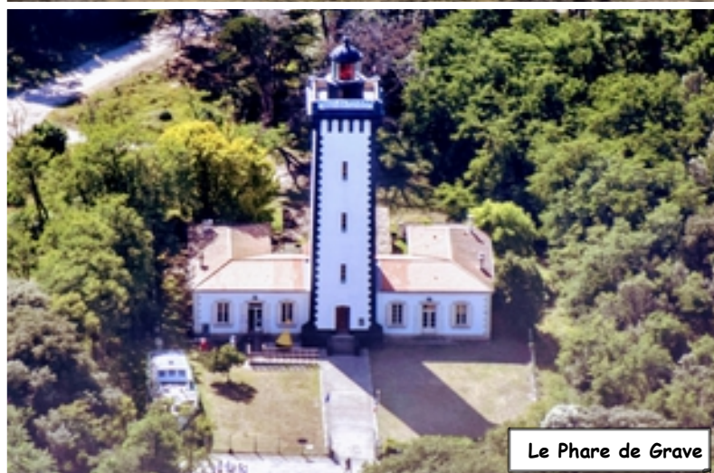
Le Phare de Grave